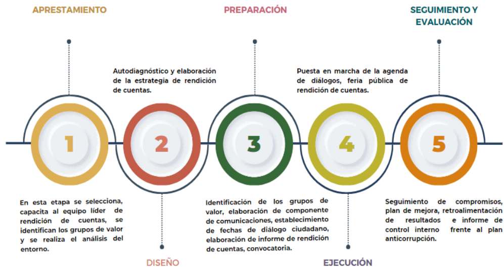
Figura 2- Etapas rendición de cuentas

La Estrategia de Rendición de Cuentas se enmarca en la etapa de diseño, teniendo como base la información recopilada durante la etapa de aprestamiento, la cual constituye un insumo fundamental para su elaboración. En este sentido, para estructurar la estrategia fue necesario definir diversas actividades en la fase de aprestamiento del proceso de rendición de cuentas, que se describen a continuación.