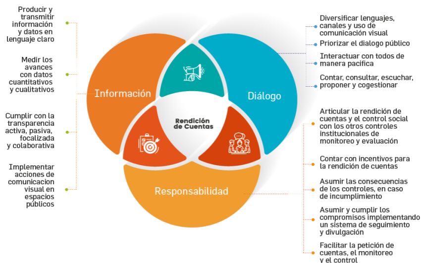
Figura 1- Elementos rendición de cuentas

Nota: Tomado de información publicada por el Departamento Administrativo de la Función Pública. Recuperado el 9 de septiembre de 2025 de ( https://www1.funcionpublica.gov.co/web/murc/cuales-son-los-elementos-de-la-rendicion-de-cuentas )